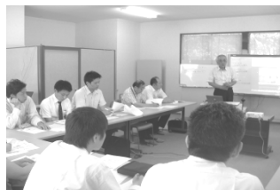
サーフボードセミナー風景

国内最大手ポータルサイト「Yahoo! Japan」が検索エンジンおよび検索連動型の広告配信システムをGoogleが提供するものに切り替えることが明らかになりました。切り替わる時期については、後日発表されるとのことです。