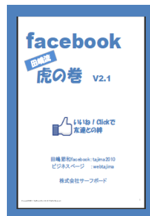
田嶋流facebook虎の巻は カラー版12ページ構成

最近では、ノートPCやスマートフォンを持参されてセミナー受講する方が増えていますので、無線LAN(Wi-Fi)環境が整っていますとよりベターです。